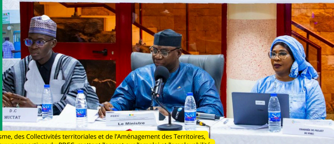
Balla Moussa Fofana, Ministre de l'Urbanisme, des Collectivités territoriales et de l'Aménagement des Territoires, préside une réunion stratégique consacrée aux perspectives du PDEC, mettant l'accent sur l'emploi et l'employabilité.

L'approche du PDEC présente une valeur stratégique forte dans le contexte du développement territorial en Casamance, car elle combine de manière cohérente la réponse aux besoins immédiats d'emploi et la construction de bases économiques durables. À travers les chantiers d'infrastructures communautaires, les activités à haute intensité de main-d'œuvre et les sous-projets productifs, le projet génère des opportunités d'emplois et de revenus à court terme, tout en soutenant le développement d'activités économiques locales dans des filières telles que l'agriculture, l'élevage, le maraîchage ou la transformation de produits locaux.