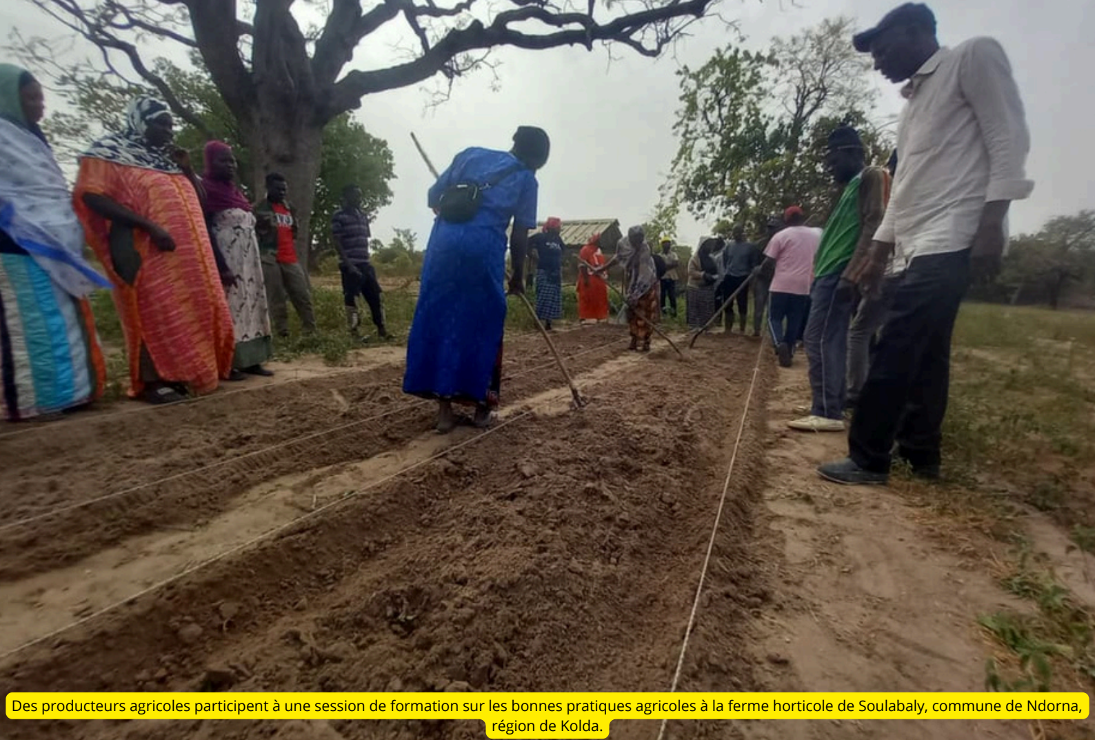
Des producteurs agricoles participent à une session de formation sur les bonnes pratiques agricoles à la ferme horticole de Soulabaly, commune de Ndorna, région de Kolda.