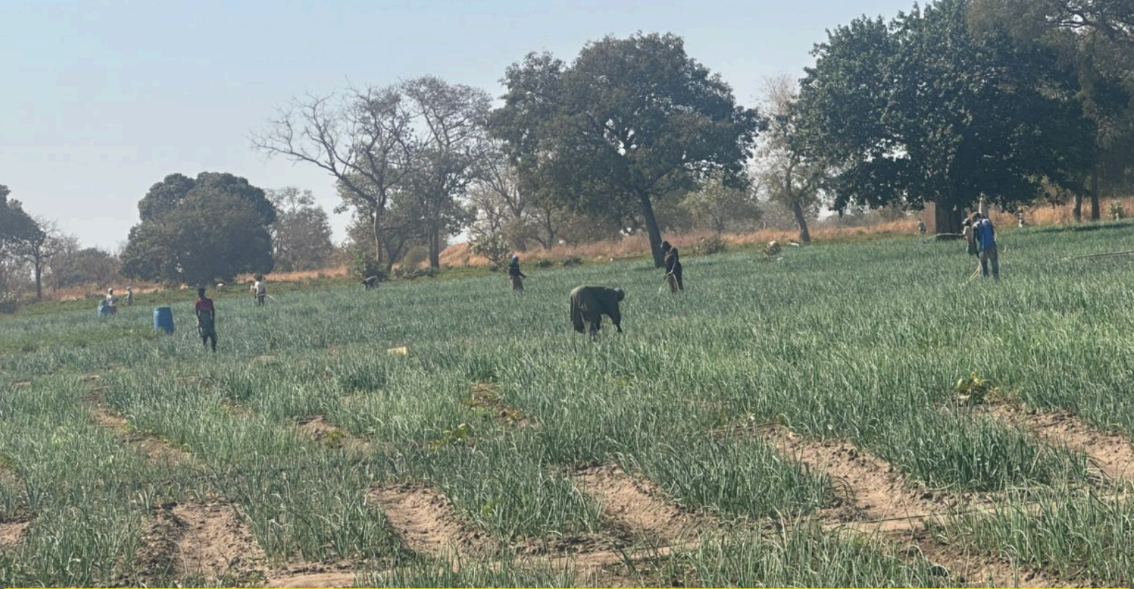
Activités de production horticole dans l'une des cinq fermes appuyées par le PDEC, contribuant au renforcement de la production locale et à l'amélioration des revenus des bénéficiaires.

L'approche du PDEC en matière d'emplois et d'employabilité ne se limite pas à la production de résultats quantitatifs en termes de nombre d'emplois créés. Elle repose sur une stratégie intégrée qui combine la création d'opportunités économiques immédiates, le renforcement des capacités productives locales et l'ancrage institutionnel des interventions dans les dynamiques territoriales. En soutenant les initiatives des organisations communautaires de base, en favorisant la participation active des jeunes et des femmes et en s'appuyant sur les collectivités territoriales, le projet contribue à structurer des filières économiques locales et à renforcer la résilience des communautés.